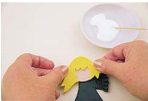
Cole o cabelo na cabeça. Cole a cabeça no corpo.