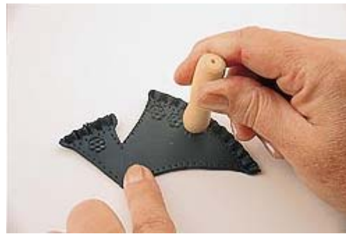
Com o carimbo de florzinha decore a saia e a manga.