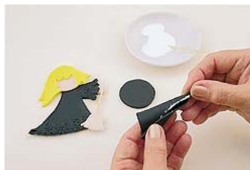
Para o chapéu, faça um cone.