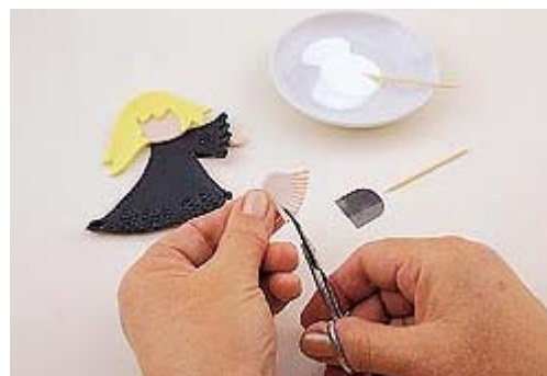
Para as mãos, faça uma bolinha na cor da pele, achate e cole na manga. Para a vassoura, recorte com o molde, faça a franja e cole no palito de dentes.