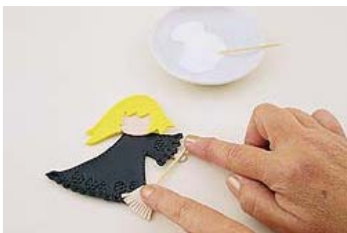
Cole a vassoura entre as mãos e a saia.