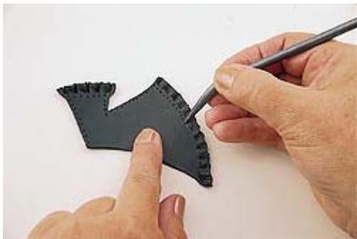
Pontilhe com a esteca todas as laterais.